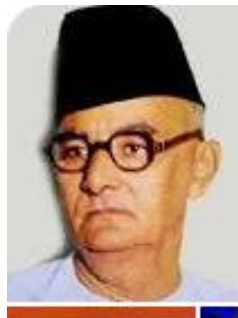
Dato Onn Bin Jaafar

9 Apakah jasa tokoh berikut terhadap penubuhan Persekutuan Tanah Melayu 1948?